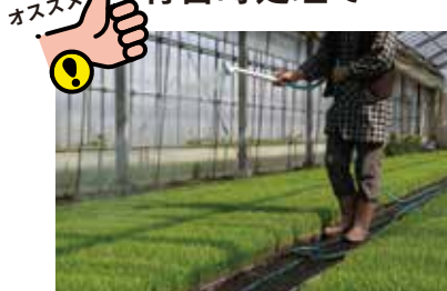
緑化初期～田植え3日前までに灌注