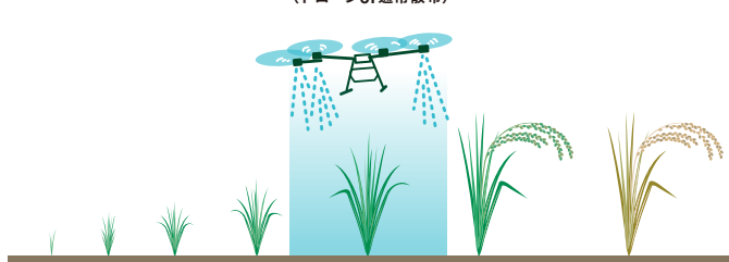
幼穂形成期～出穂期散布