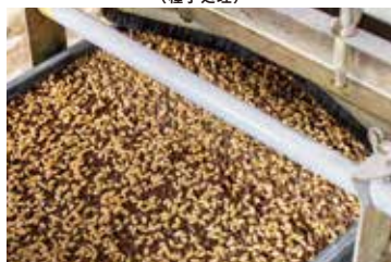
播種機の灌水装置への適用