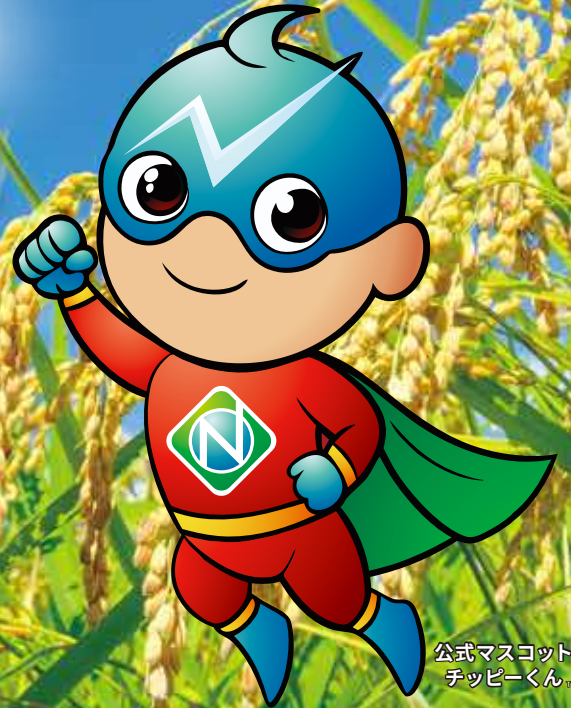
公式マスコット チッピーくん